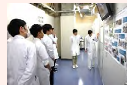
医療の最先端が見えます！

見学者のみなさんに感想を聞いてみると「研修医とのランチ座談会で沢山の話が聞けた」「希望の診療科見学で科の雰囲気わかりモチベーションが上がった」など嬉しい言葉をいただきました。夏の見学会は8月9～10日を予定しています。詳細は次号またはホームページをご覧ください。