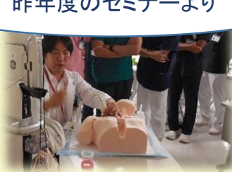
超音波ガイド下静脈穿刺