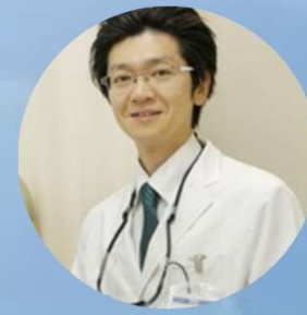
若き開業医× 凄腕サージャン