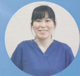
3児のママ× 聞こえの スペシャリスト