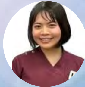
合唱日本代表× 後期研修医