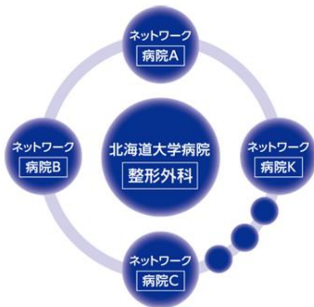
図1. 北海道クラーク（北海道大学）整形外科専門研修プログラム （研修期間：3年9か月間）