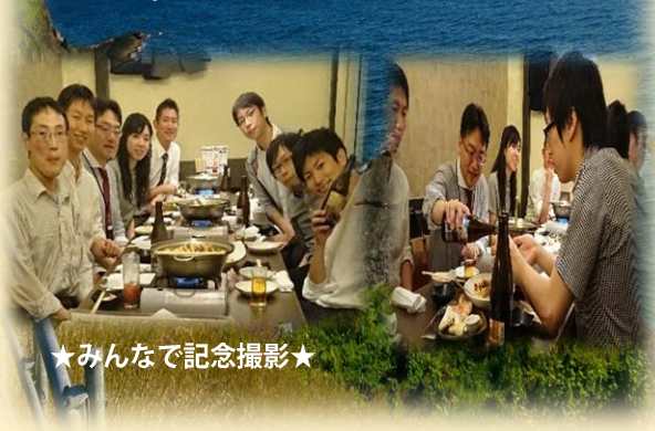
★みんなで記念撮影★

平成28年度より行われている鹿児島大学病院との連携事業。今年も北海道地域医療研修のため道内医療機関で研修中の鹿児島大学病院の研修医3名をお迎えし、研修医交流会を開催しました!! すでに鹿児島地域医療研修を終えた北大病院の研修医も交え、互いに情報交換をしながら話に花を咲かせていました。